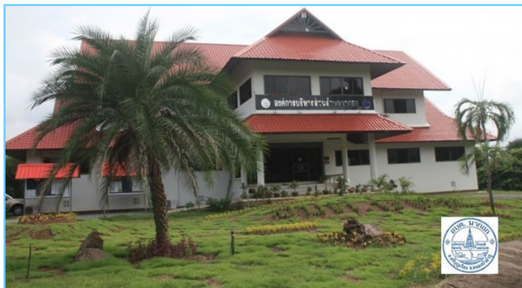
ภาพที่ 3 อาคารสำนักงานองค์การบริหารส่วนตำบลนาออก