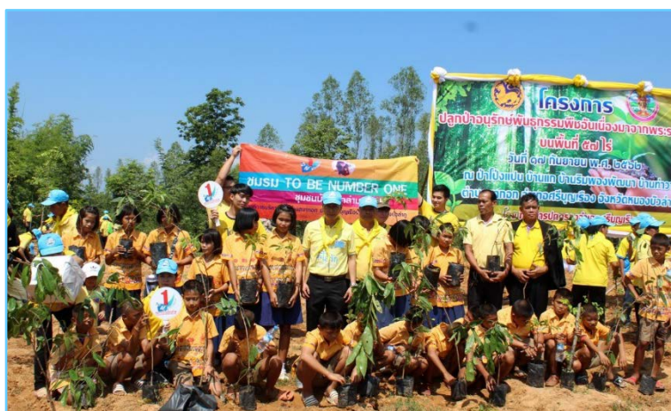
ภาพที่ 6 สมาชิกโครงการ TO BE NUMBER ONE เข้าร่วมกิจกรรมปลูกป่า

นอกจากกิจกรรมในลักษณะข้างต้นแล้ว องค์กรบริหารส่วนตำบลนาออก ยังได้จัดสรรพื้นที่บางส่วนในหน่วยงาน ให้โครงการ TO BE NUMBER ONE เปิดร้านกาแฟและให้กลุ่มเยาวชนเข้ามาดำเนินการ และบริหารทั้งหมด โดยองค์กรบริหารส่วนตำบลได้สนับสนุนงบประมาณเริ่มต้นของการดำเนินงาน