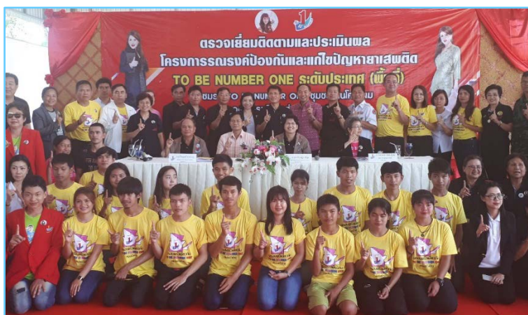
ภาพที่ 5 สมาชิกโครงการ TO BE NUMBER ONE และคณะผู้ตรวจเยี่ยม

โครงการ TO BE NUMBER ONE องค์การบริหารส่วนตำบลนาออก มีการบริหารงานแบบ บูรณาการร่วมกันของทุกส่วนงานในองค์กร แต่มีส่วนงานหลักที่รับผิดชอบ คือ กองสวัสดิการสังคม และ กองการศึกษา ศาสนา และวัฒนธรรม โดยได้ประชาสัมพันธ์เชิญชวนให้เยาวชนในตำบลเข้าร่วมโครงการ TO BE NUMBER ONE ผ่านช่องทางต่าง ๆ ดังต่อไปนี้ 1) website ขององค์การบริหารส่วนตำบลนาออก 2) facebook.com/องค์การบริหารส่วนตำบลนาออก 3) ป้ายปิดประกาศประชาสัมพันธ์ขององค์การบริหารส่วนตำบลนาออก 4) หนังสือแจ้งประชาสัมพันธ์กับโรงเรียนต่าง ๆ ในตำบลนาออก และ 5) หนังสือแจ้งประชาสัมพันธ์ผู้ใหญ่บ้านทุกหมู่บ้านในตำบลนาออก เพื่อประกาศหอกระจายข่าว และติดประกาศใน ศาลากลางหมู่บ้าน เพื่อให้ประชาชนได้รับทราบข้อมูลอย่างทั่วถึง