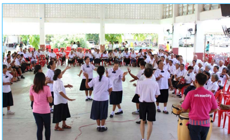
ภาพที่ 8 การทำกิจกรรมโรงเรียนผู้สูงอายุ

ฝีมือแรงงานจังหวัดหนองบัวลำภู ทั้งนี้ การดำเนินงานหลักจะเป็นบทบาทขององค์การบริหารส่วนตำบล นากอก และเป็นสถานที่จัดกิจกรรม โดยได้ประชาสัมพันธ์เชิญชวนให้ผู้สูงอายุในตำบลเข้าร่วมโครงการผ่านช่องทางต่าง ๆ ดังต่อไปนี้ 1) website ขององค์การบริหารส่วนตำบลนากอก 2) facebook.com/องค์การบริหารส่วนตำบลนากอก 3) ป้ายปิดประกาศประชาสัมพันธ์ขององค์การบริหารส่วนตำบลนากอก 4) กลุ่มไลน์ (Line) ของอาสาสมัครสาธารณสุขตำบลนากอก (อสม.นากอก) และ 5) หนังสือแจ้งประชาสัมพันธ์ ผู้ใหญ่บ้านทุกหมู่บ้านในตำบลนากอก เพื่อประกาศหอกระจายข่าว และติดประกาศในศาลากลางหมู่บ้าน เพื่อให้ประชาชนได้รับทราบข้อมูลอย่างทั่วถึง