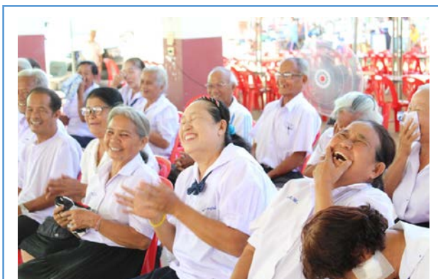
ภาพที่ 9 รอยยิ้มแห่งความสุขของนักเรียน

2) โครงการโรงเรียนผู้สูงอายุ ทำให้ผู้สูงอายุที่เข้าร่วมโครงการได้ร่วมกันทำกิจกรรมนันทนาการ แลกเปลี่ยนเรียนรู้กับกลุ่มเพื่อนผู้สูงอายุด้วยกัน ทำให้ผู้สูงอายุมีความกระตือรือร้นในการเข้าร่วมกิจกรรม มีความสุขเต็มเปี่ยมไปด้วยรอยยิ้มและเสียงหัวเราะ